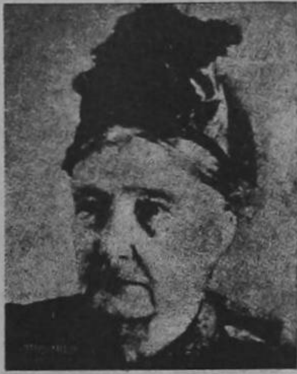
D a LEONOR PEREZ DE MARTI

Nació doña Leonor Pérez y Cabrera, madre del Apóstol, en Santa Cruz de Tenerife, Islas Canarias, el 17 de diciembre de 1828, casando en febrero de 1852 con don Mariano Martí y Navarro.